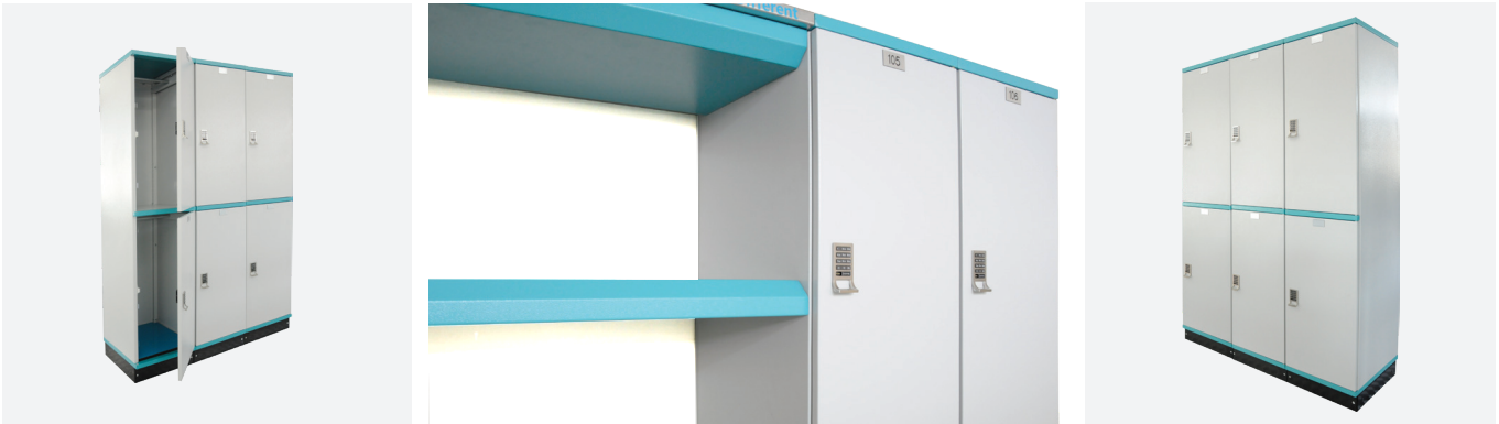
Data sheet for metal clad locker 4 compartments

The steel locker features a moisture-proof, anti-tipping design with optional smart lockers (digilock) Reinforced with a profile that is integrated into the door and extends into the housing. Opening angle 120° -180°. The organizer locker is simple in appearance and rich in storage, which is warmly welcomed in life and workspace